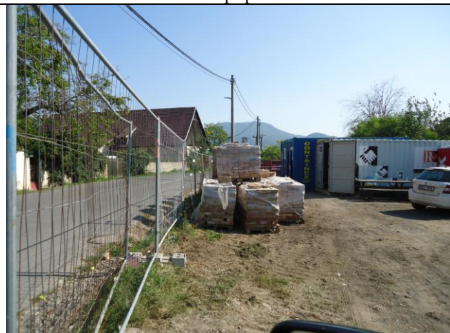
Pořádek na staveništi průběžně dodržován. Materiál uložen na paletách, zabezpečen folií proti sesuvu.