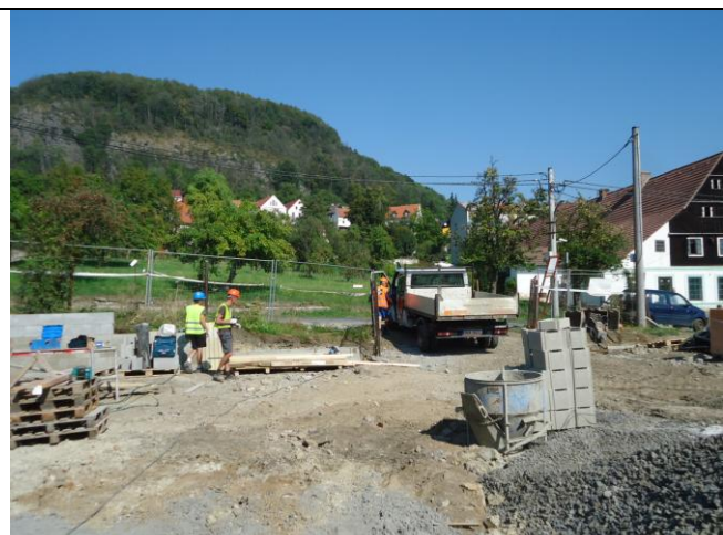
V době KD všichni přítomní zaměstnanci byli vybaveni OOPP. Bez připomínek.