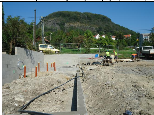
Práce jsou prováděny dle odsouhlaseného plánu BOZP a technologických postupů. Bez připomínek