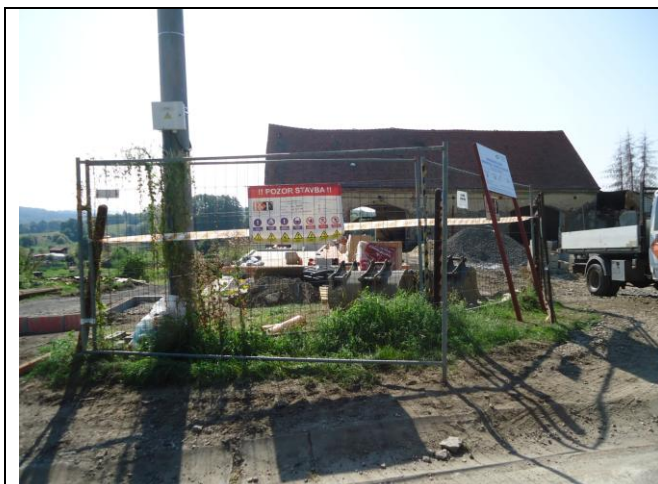
Oplocení staveniště pevným plotem dle požadavku plánu BOZP. Vstup označen výstražnými nápisy a piktogramy.

Fotodokumentace je průběžně prováděna a bude k dispozici vyžádání.