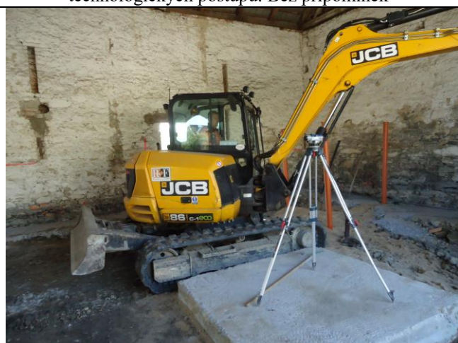
Práce jsou prováděny dle odsouhlaseného plánu BOZP a technologických postupů. Bez připomínek.