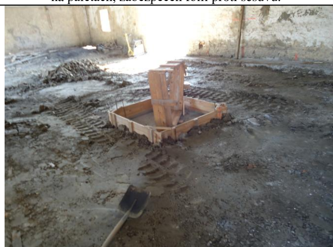
Práce jsou prováděny dle odsouhlaseného plánu BOZP a technologických postupů. Bez připomínek.