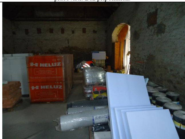
Dodržovat bezpečné pracovní a únikové uličky.