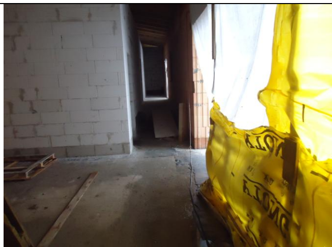
Pozor na volně ležící kabely elektrických zařízení.