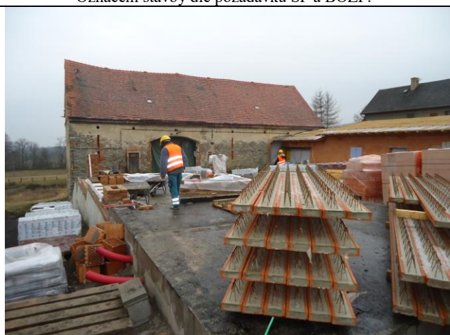
V době KD bylo všemi pracovníky používání OOPP bez výhrad.