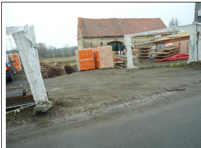
Výjezd na hlavní komunikaci udržován v čistotě.