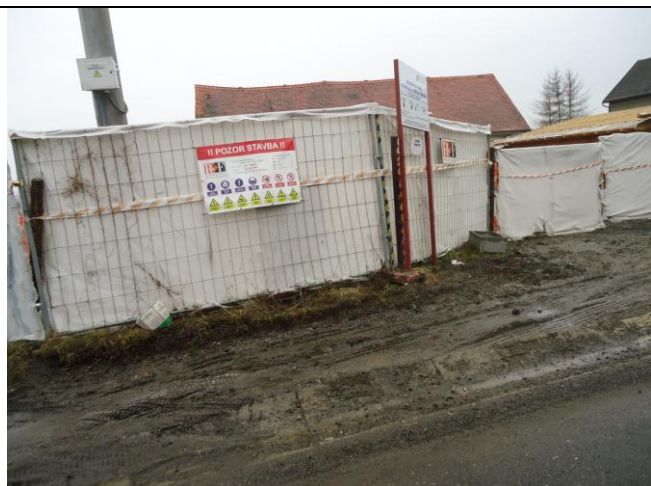
Označení stavby dle požadavku SP a BOZP.