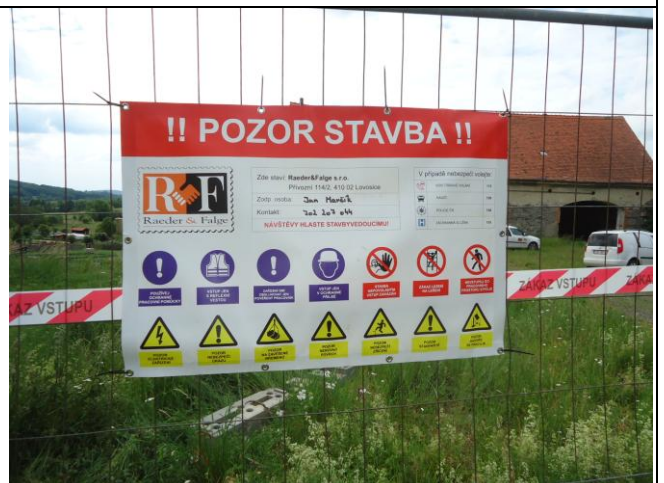
Staveniště je osazeno požadovaným označením a piktogramy.