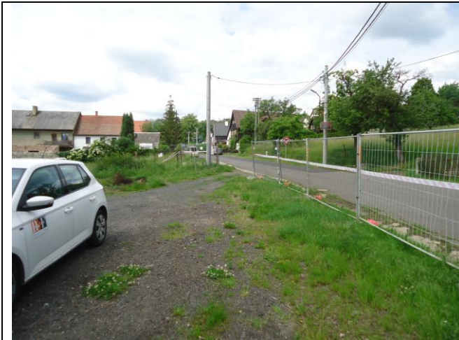
Oplocení staveniště pevným plotem dle požadavku plánu BOZP.