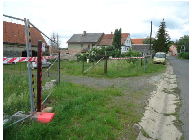
Vjezd na staveniště uzavíratelnou branou.