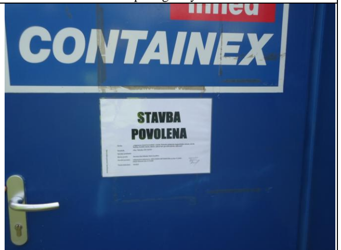
Stavební povolení vyvěšeno na viditelném přístupném místě- kanceláři stavby.