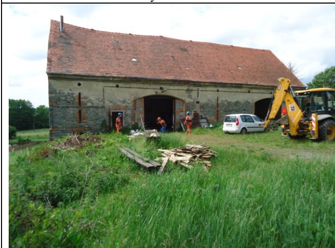
Používání OOPP dodržováno všemi přítomnými pracovníky.