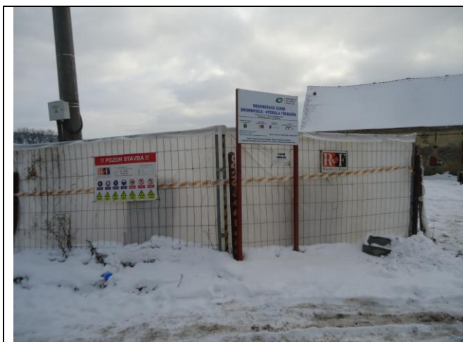
Zabezpečení staveniště pevným plotem je dle požadavku plánu BOZP. Zabezpečit komunikaci posypem.

Fotodokumentace je průběžně prováděna a bude k dispozici vyžádání.