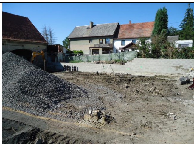
Pořádek na staveništi průběžně dodržován.