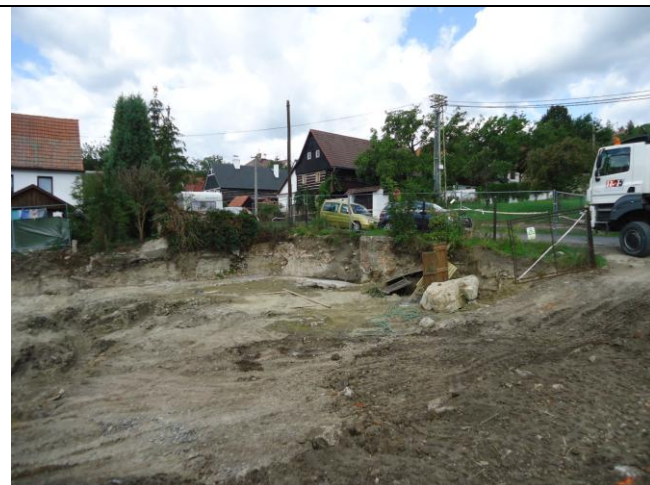
Oplocení staveniště pevným plotem dle požadavku plánu BOZP.

Fotodokumentace je průběžně prováděna a bude k dispozici vyžádání.