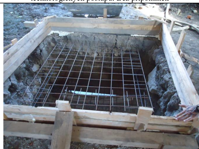
Práce jsou prováděny dle odsouhlaseného plánu BOZP a technologických postupů. Bez připomínek.