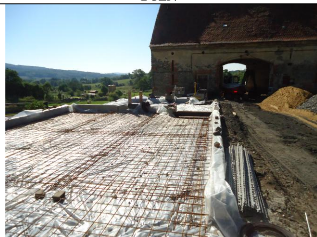
Práce jsou prováděny dle odsouhlaseného plánu BOZP a technologických postupů. Bez připomínek