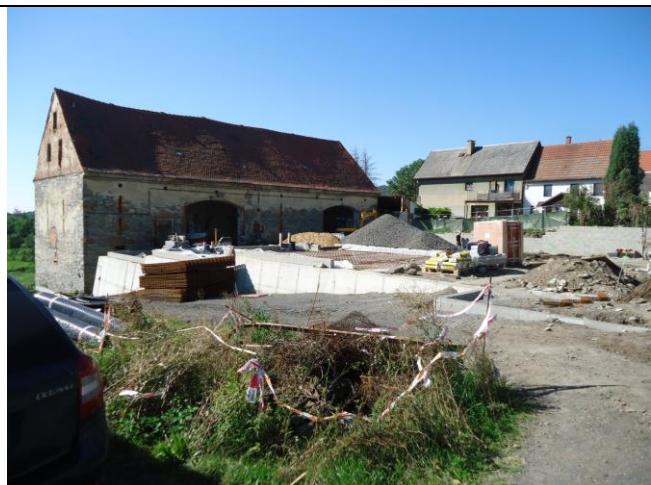
Pracovní výkopy a jámy zabezpečeny zapáskováním.