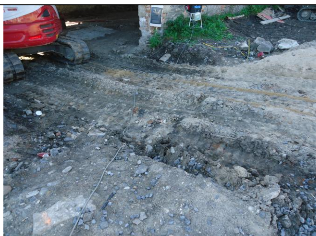
Kabely se musí zabezpečit v případě pojezdu vozidel chráničkou.