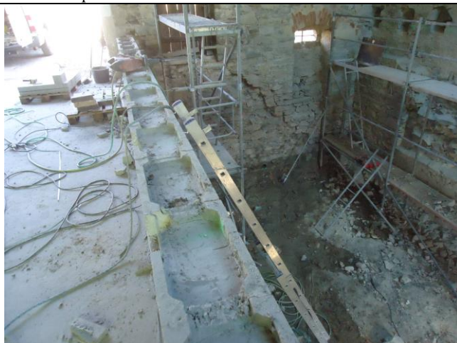
Používaný žebřík je zajištěn proti skluzu a má požadovaný přesah nad výstupní plochu.