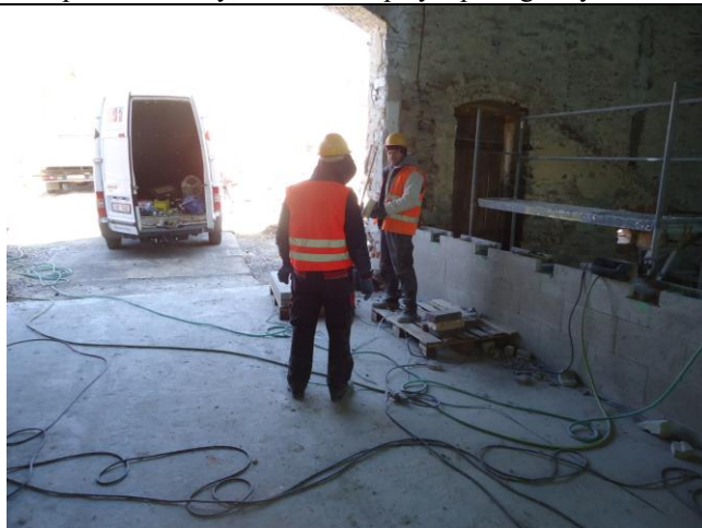
V době KD vylo všemi přítomnými pracovníky dodržováno používání OOPP. Pozor na uložení kabelů.