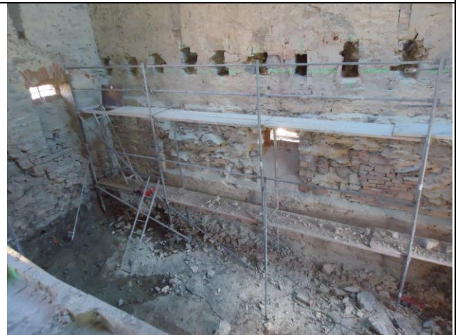
Místa, ze kterých by mohl hrozit pád z výšky (lešení) musí být zabezpečeny oboustranným zábradlím.