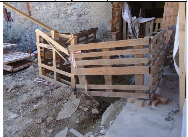
Zabezpečení pracovních výkopů je v souladu s požadavkem plánu BOZP.