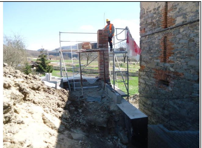
Doložit montážní a předávací protokol od lešení.