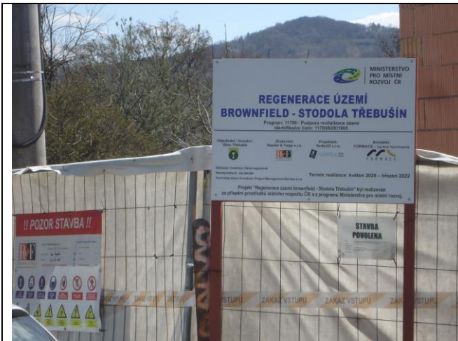
Oplocení stavby, označení nápisy a piktogramy. OK.